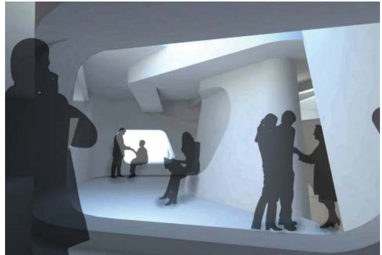
Blick aus der Pantry

Eine neue Treppenskulptur wickelt sich vom Erdgeschoß in das obere Geschoß und entfaltet sich hier in ein organisches Wandgefüge, das fließend die Räumlichkeiten strukturiert und Einbauten wie Sitznischen, Einbauregale und Pantryküche integriert. Den besonderen Ort für exklusive Anlässe bildet eine Skybox, die über dem Obergeschoß als organisches Bindeelement zur Dachterrasse eingehängt ist und einen weiteren Besprechungsraum in exponierter Lage mit Dachanbindung ausformuliert.