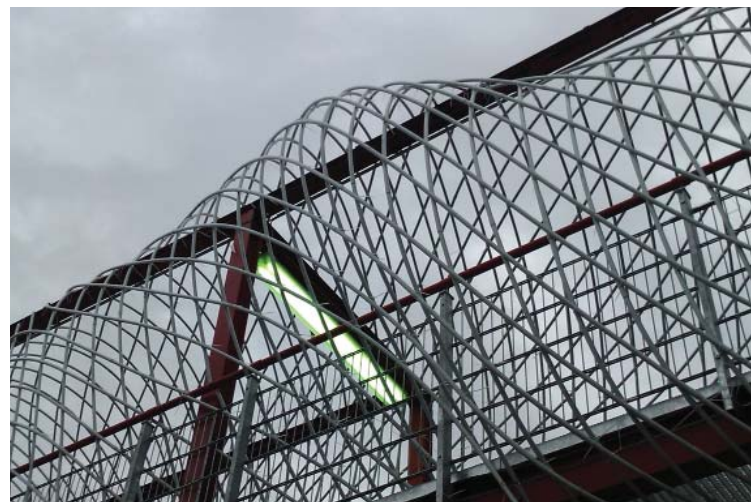
Die Skulptur stzt sich über die formale Brücke hinweg