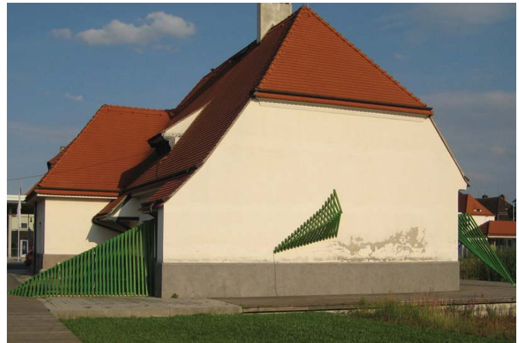
Der Schafstall und Parascapes