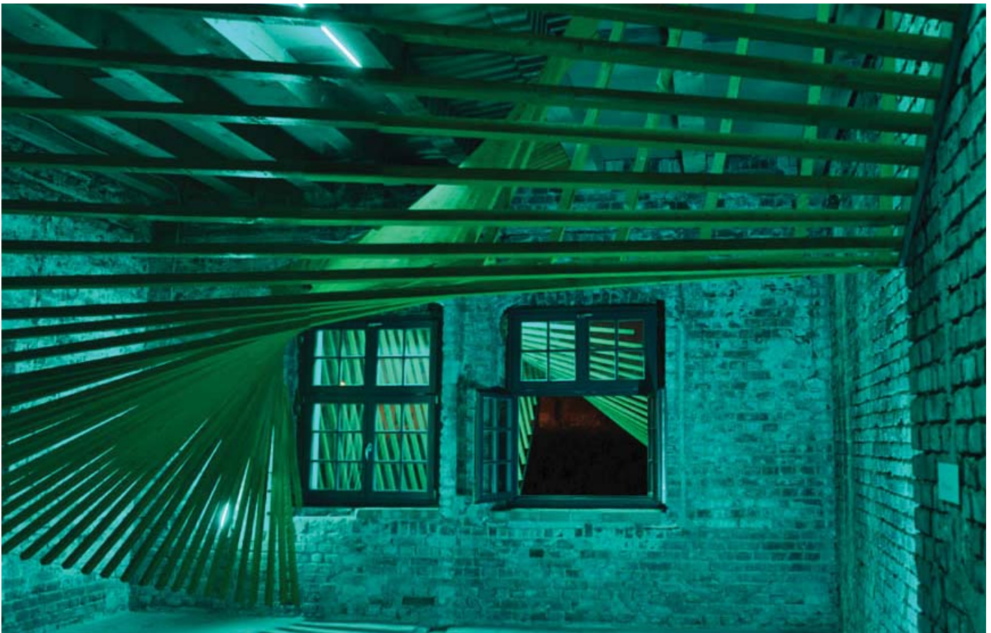
Parascapes im Schafstall