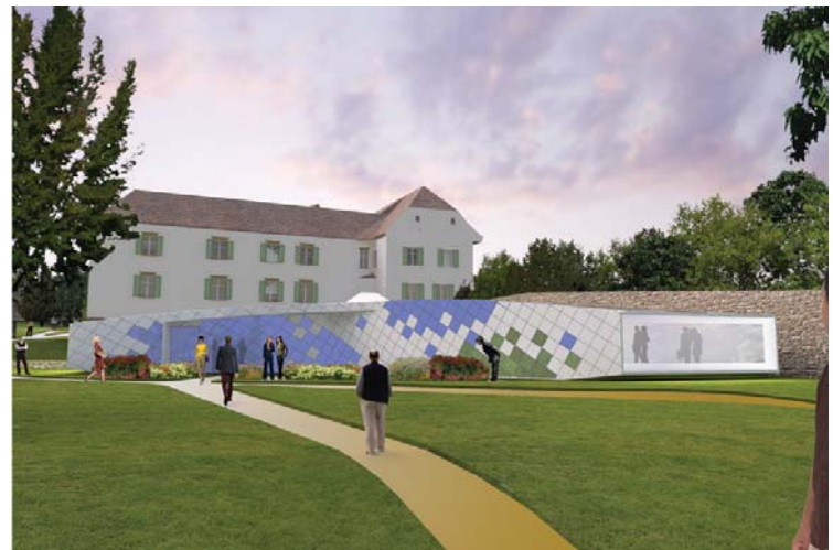
Zubau Ost - Pavillon