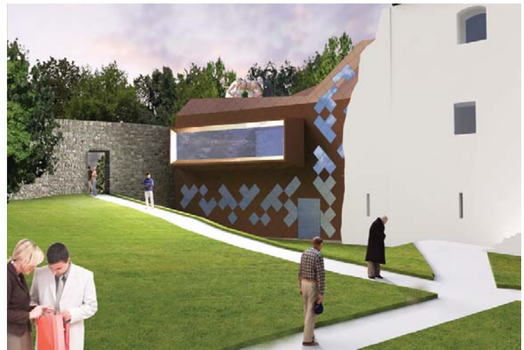
Anbau West - Service Räume

Dieser Baukörper orientiert sich gleichermaßen zu seinen zwei wichtigen Bezugspunkten: Der Blick vom Haupteingang in den Stadtpark und der nördliche Zugang durch die Maueröffnung von der Brühlgasse. Die Organisation als repräsentativer, offener Pavillon und effektives Produktionsgebäude geben dem Baukörper seine charakteristische Figur, in der das „Gläserne Labor“ als öffentliche Plattform der Kosmetikfirma Ringana seinen Platz bekommen wird.